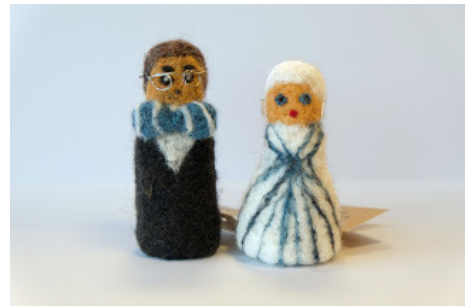
Pildil: Töötoas vilditud presidendipaar

Enamasti alustavad teenuse saajad meie majas tööd juhendaja käe all ja see on hüppelauaks, et nad saaksid minna meilt edasi avalikule tööturule. Töötubades omandavad nad uusi oskusi, töödistsipliini, kohanevad seltskonnaga ja arendavad oma suhtlemisoskusi. On ka neid, kes oma tervisliku seisundi tõttu ei olegi valmis töötama avatud tööturul, kuid on meie majas see- eest aktiivsed töötegijad.